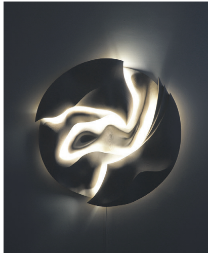
Et af Egeværks måneværker. Natside er fremstillet specielt til Bornholms Hospital og kan først ses ved afsløringen den 6. september.

Afsløringen finder sted ved hovedindgangen på Bornholms Hospital på Ullasvej 8 i Rønne.